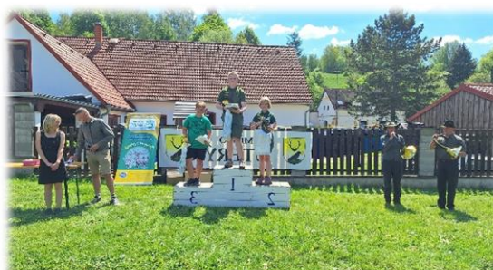
Vítězné kategorie „A“