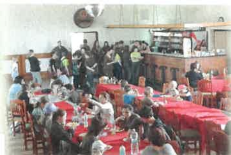
Chvilku klidu před vědomostním testem