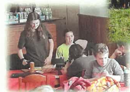
Účastníci 52. ročníku ZST v Rakové