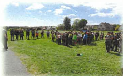
Slavnostní zahájení 52. ročníku ZST Raková