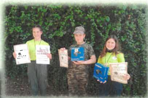
Úspěšní účastníci z mysliveckého kroužku Chlumčany